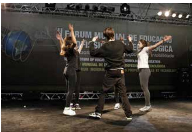
Figura1 – Apres. Fórum Mundial-Florianópolis - 2012

A dança como uma linguagem não verbal, possibilita a compreensão dos sentidos significados pelo corpo. Segundo GAIARSA, (1995), A linguagem não verbal contagia o corpo, exterioriza a alma. A dança dá sustentação, força e sentido aos pronunciamentos verbais e posições no espaço que o homem executa ao se relacionar com o grupo.