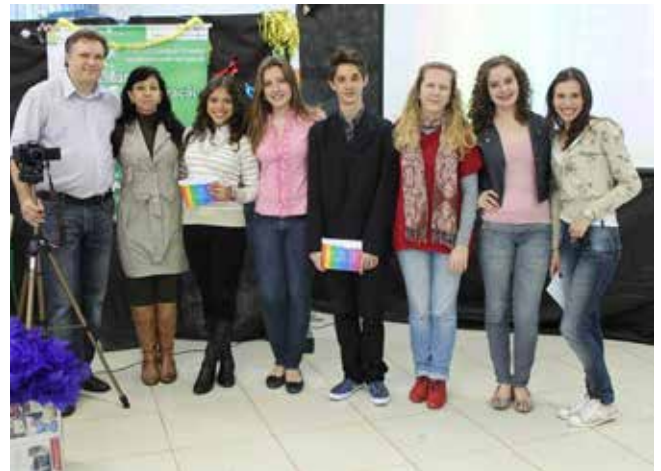
Figura 2 – Apresentação do Projeto.