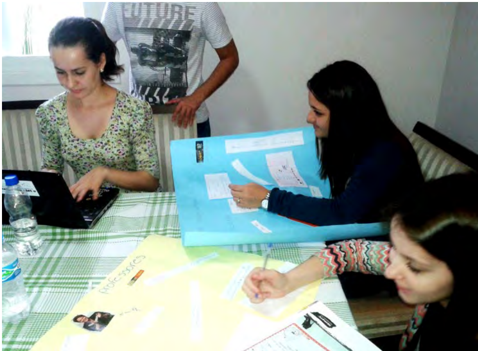
Figura 1: Análise do material produzido.