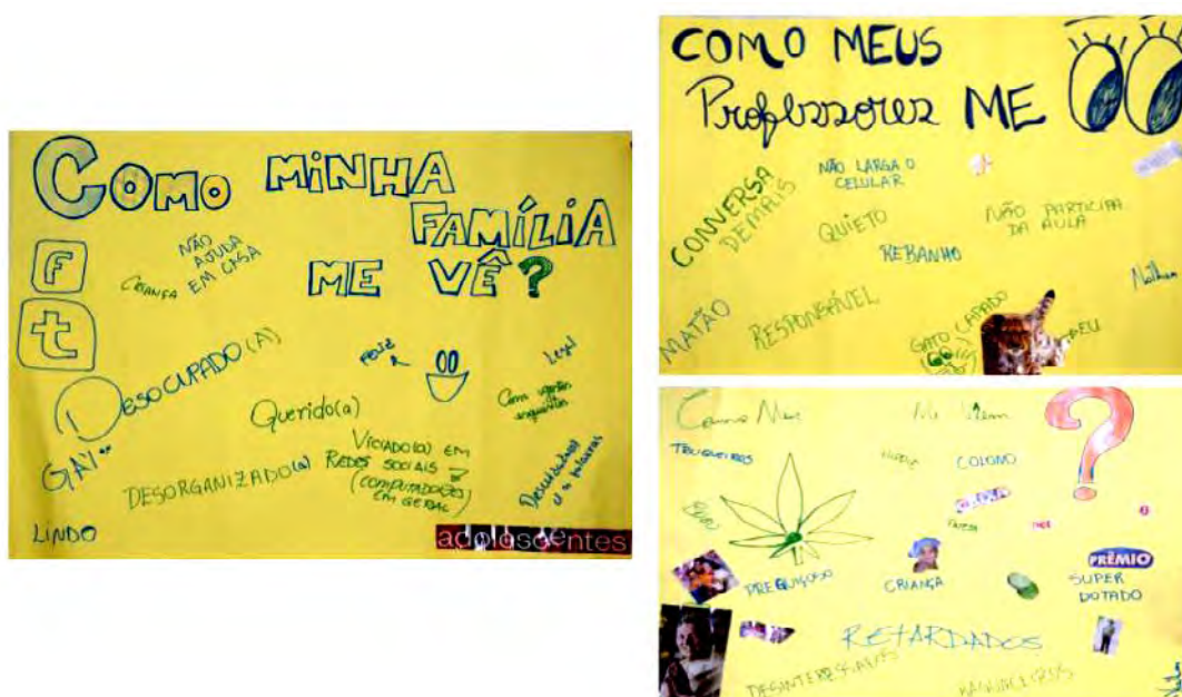
Figura 2: Cartazes elaborados.

No primeiro encontro, foi proposta a atividade de elaboração de três cartazes, nos quais cada um fez sua contribuição. Os cartazes tiveram os seguintes temas: “Como os meus familiares me veem?”, “Como os meus professores me veem?” e “Como os meus colegas me veem?”. Para criá-los, os participantes contaram com revistas, tesouras, lápis de cor e caneta. Ao final da dinâmica, os estudantes apresentaram a produção de seus cartazes e houve discussão entre todos sobre o que foi confeccionado.