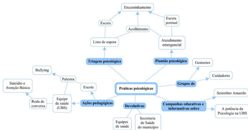
Figura 3: Práticas psicológicas desenvolvidas nas UBSs

A exemplo disso, a universitária participou ativamente do planejamento coletivo, da execução - individual e/ou conjunta - e da avaliação contínua de intervenções no campo da psicologia em saúde, como pode-se observar na Figura 3. Indo para além da triagem psicológica em consultório, a qual foi o foco das solicitações da gestão e das equipes durante o primeiro ano de prática.