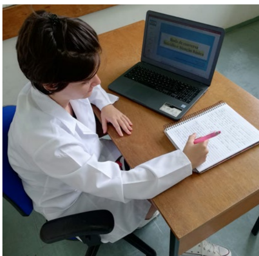
Figura 4: Universitária planejando ação pedagógica

Diante do exposto, reitera-se a importante e necessária parceria entre IES e UBS a fim de atender a uma das diretrizes da Política Nacional de Atenção Básica (PNAB) que é “o acesso universal e contínuo a serviços de saúde de qualidade e resolutivos” (BRASIL, 2017, Cap. 1), favorecendo a garantia do acesso ao SUS pela sua principal e preferencial porta de entrada – UBS – por meio de acolhimento, escuta e oferta de resposta positiva frente às necessidades da população assistida. De igual modo, a universitária entrou em contato com problemas reais e precisou articular-se não só com psicólogos, mas com os demais profissionais da equipe multiprofissional a fim de viabilizar estratégias resolutivas e eficazes, de forma interdisciplinar (Figura 4).