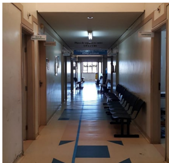
Figura 2: Salas no corredor de uma UBS

De pronto, percebe-se que o lugar, inclusive físico, da psicologia na saúde ainda está sendo conquistado e muitas vezes disputado entre profissionais, pois observou-se que, apesar da enorme lista de espera para triagem psicológica, quando há concorrência entre os profissionais por salas (Figura 2), os médicos têm preferência.